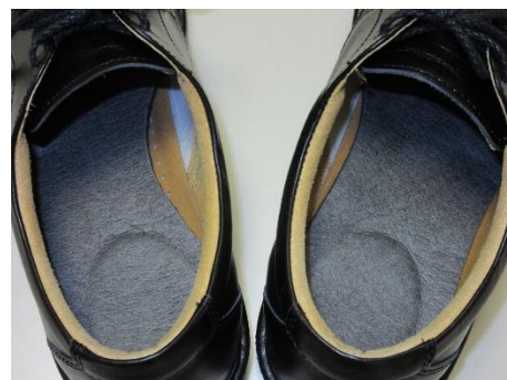
左足側をカットした映像